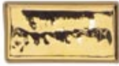
HTL 001 Oro Brillante 8%