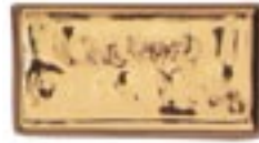
HTL 008 Oro Brillante 12%