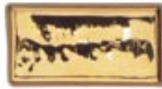
HTL 002 Oro Brillante 10%