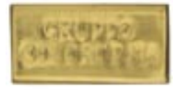
HTL 006 Oro Matt 18%