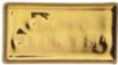
HTL 003 Oro Limone 10%